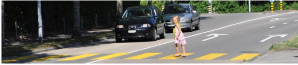
Swiss-quality markings & coatings

Basler Lacke AG Bresteneggstrasse 17 5033 Buchs, Switzerland Phone +41 62 837 93 00 Fax +41 62 837 93 60 info@basler-lacke.ch www.basler-lacke.ch